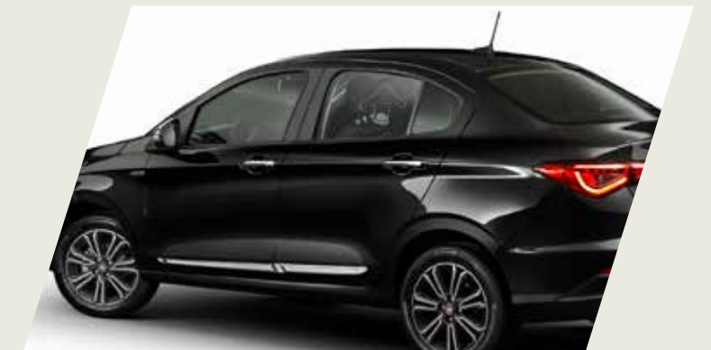
MOLDURA DE PUERTA CROMADA