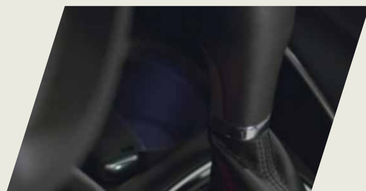
KIT ILUMINACION INTERIOR