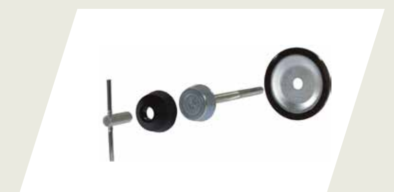
BULÓN DE SEGURIDAD PARA RUEDA DE AUXILIO