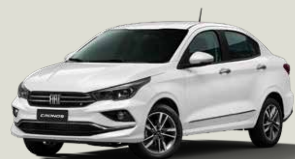
249 - Blanco Banchisa