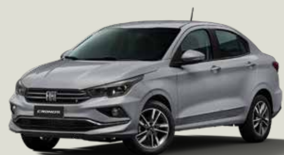
619 - Plata Bari