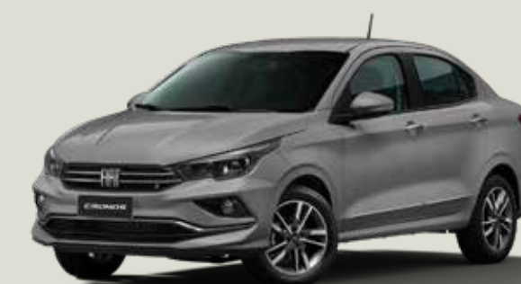
979 - Gris Silverstone