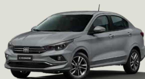
540 - Gris Strato