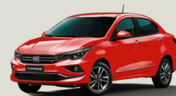
978 - Rojo Montecarlo