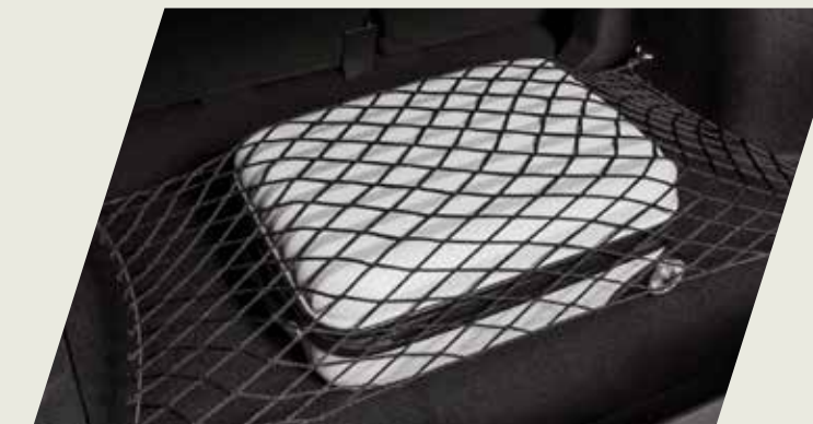
RED ELÁSTICA PARA BAUL