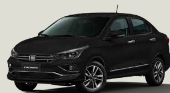
806 - Negro Vulcano